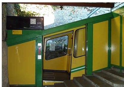
Station de la Côte.