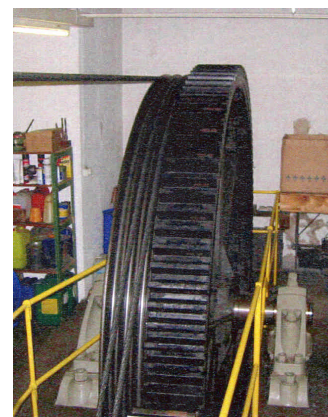
Station de Chaumont : treuil de 1910.

Dans les années 1990, les restaurations avaient commencé par le renouvellement des voitures en 1995, puis avaient été poursuivies par la reconstruction de la voie. L'année prochaine, les bâtiments de la Coudre et de Chaumont seront également rénovés. L'ensemble des travaux au funiculaire La Coudre - Chaumont se dérouleront en automne 2007, pendant 12 semaines.