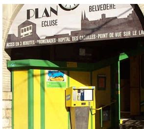
Station de l'Ecluse.

Les installations du funiculaire Ecluse – Plan ont été automatisées en 1985. Les équipements électrotechniques et électroniques, tels que les entraînements, le moteur, les asservissements électriques et électroniques, ainsi que la télécommande, doivent être renouvelés. Leurs fournisseurs ont disparu et les pièces de rechange ne sont, par conséquent, plus disponibles.