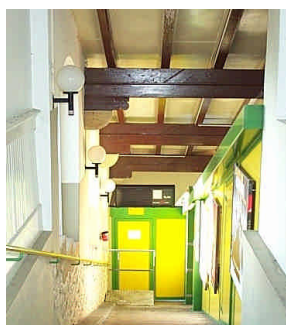
Station du Plan.